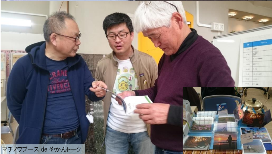
マチノワブース de やかんトーク